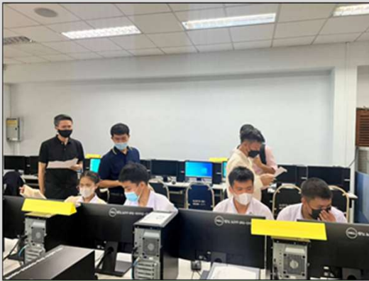
การแข่งขันเขียนโปรแกรมคอมพิวเตอร์ สำหรับพัฒนาเว็บแอปพลิเคชัน ณ มหาวิทยาลัยราชภัฏธนบุรี