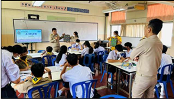
การแข่งขันทักษะทาง คณิตศาสตร์ โรงเรียนวัดบวรมงคล