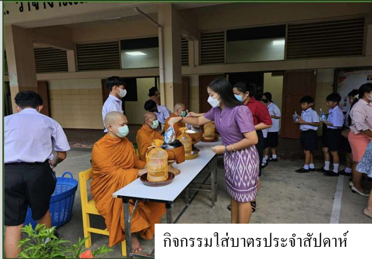
กิจกรรมใส่บาตรประจำสัปดาห์