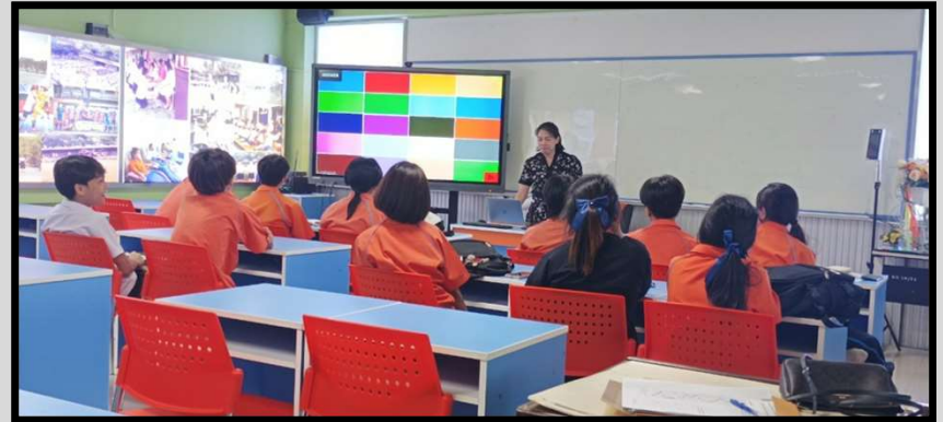
นิเทศการสอน