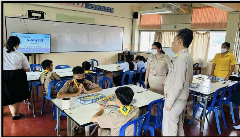
แข่งขันด้านวิชาการ ภายในโรงเรียน