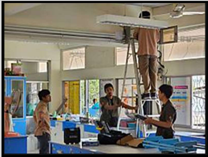
ปรับปรุงสัญญาณอินเทอร์เน็ต สำหรับระบบการเรียนการสอน