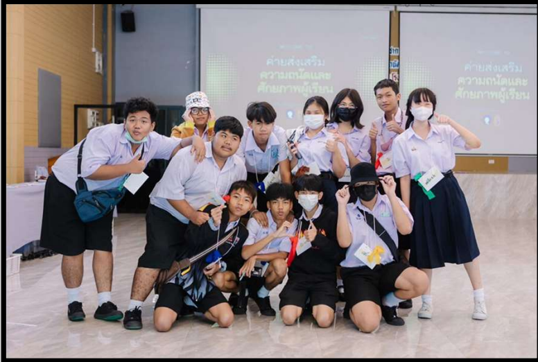
ค่ายส่งเสริมความถนัด และศักยภาพผู้เรียน