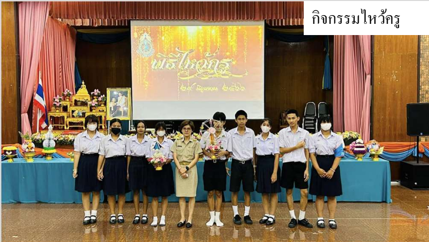
กิจกรรมไหว้ครู